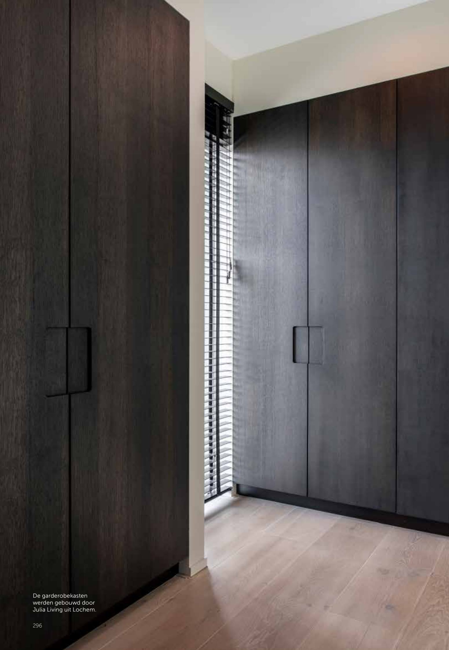
De garderobekasten werden gebouwd door Julia Living uit Lochem.