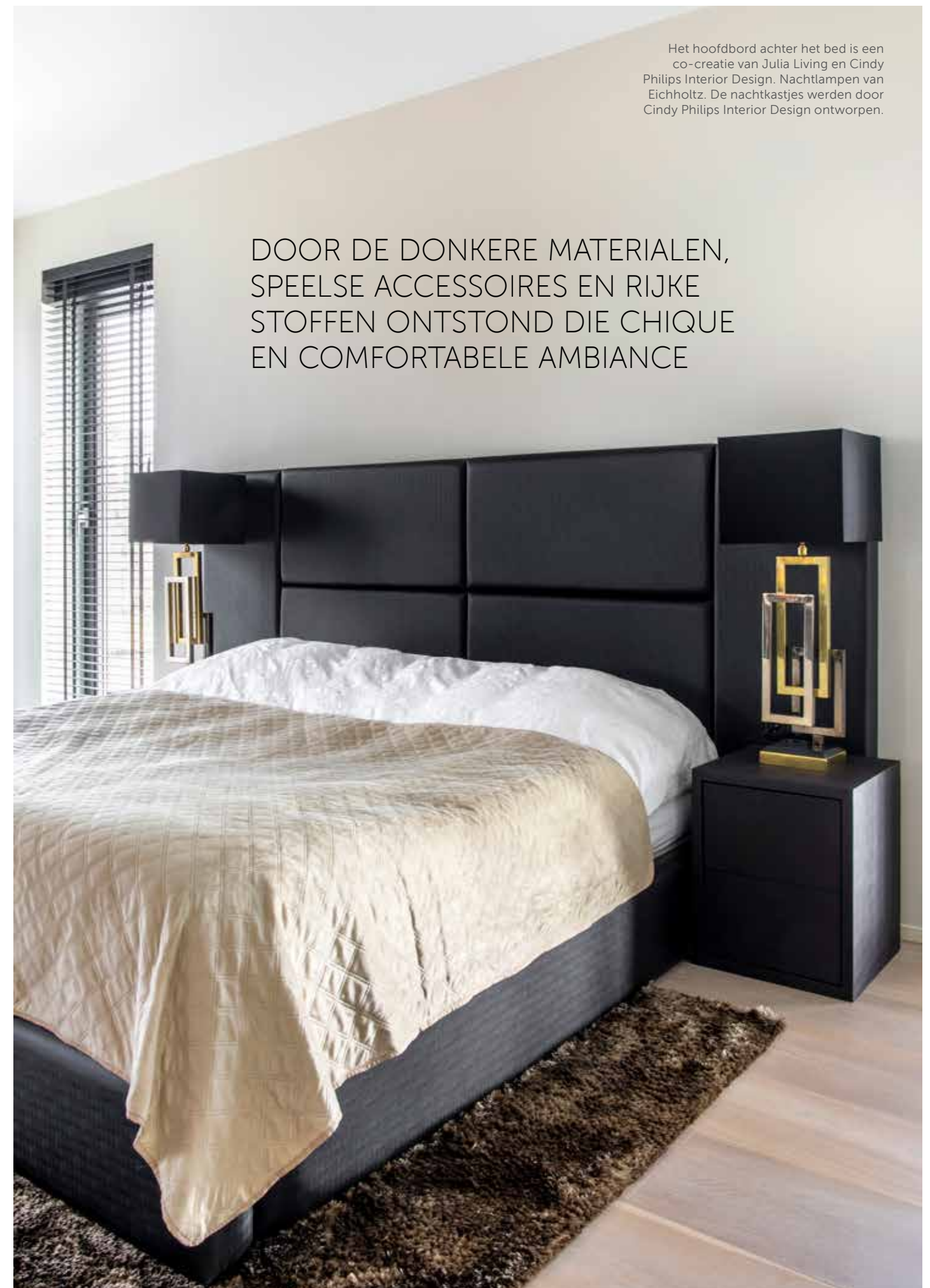
Het hoofdbord achter het bed is een co-creatie van Julia Living en Cindy Philips Interior Design. Nachtlampen van Eichholtz. De nachtkastjes werden door Cindy Philips Interior Design ontworpen.

DOOR DE DONKERE MATERIALEN, SPEELSE ACCESSOIRES EN RIJKE STOFFEN ONTSTOND DIE CHIQUÉ EN COMFORTABELE AMBIANCE