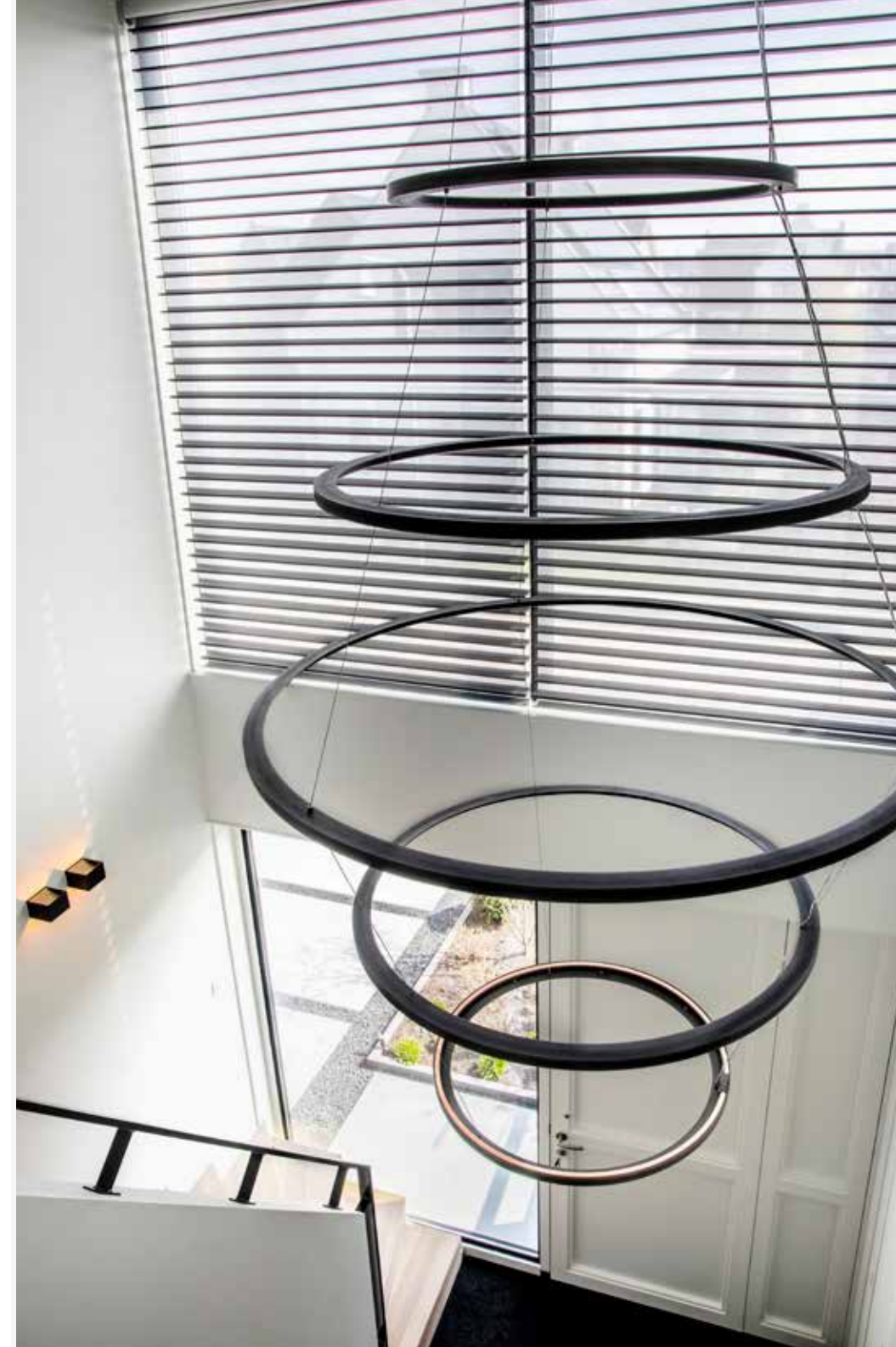
In de entree hangt een lamp van Jacco Maris.

“VOOR DE KINDEREN WAS DE VERHUIZING EEN GROTE STAP. DOOR ZE TE BETREKKEN IN DIT TRAJECT, WERDEN ZE STEEDS ENTHOUSIASTER”